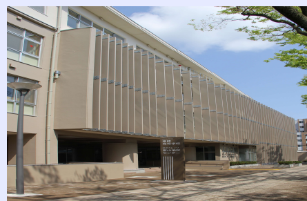
富山県立雄峰高等学校