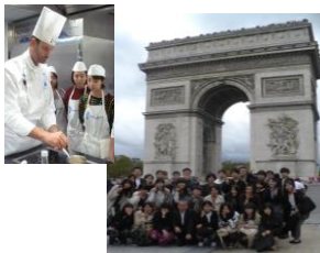
海外研修 9月下旬、隔年に実施