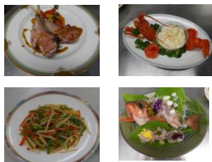
実習作品(日本・西洋・中国)