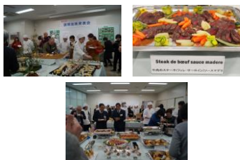
調理技術発表会(2年生) 2月上旬