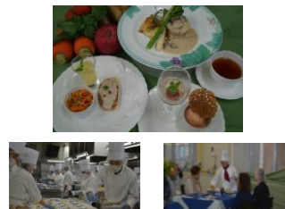
学園祭(フレンチレストラン) 11月上旬