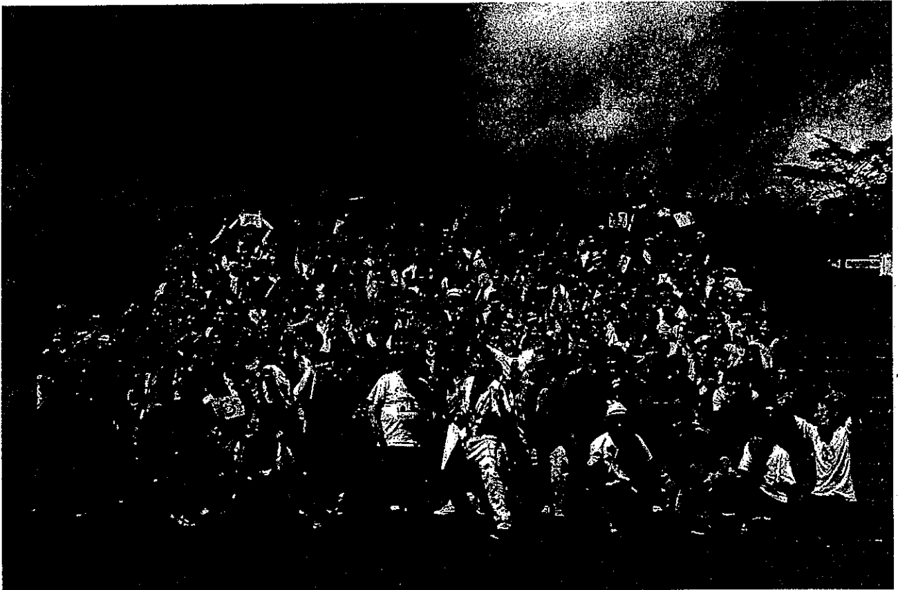
静岡県・中央のつどい

毎年夏休みに「つどい」という合宿行事を実施しています。高校奨学生の「つどい」は2泊3日の日程で、全国8会場で開催。大学・専門学校奨学生の初年度採用者を1か所に集めて行う「つどい」は4泊5日の日程で開催。有意義な学生生活を送るためにどうするかを考えてもらうため、卒業生や社会で活躍する著名人、海外の若者など多様な人材も招き、様々な刺激に触れる機会をつくっています。参加者の多くは「つどい」で夢を見つけ、一生の仲間を得たと言い、参加満足度は9割を超えています。